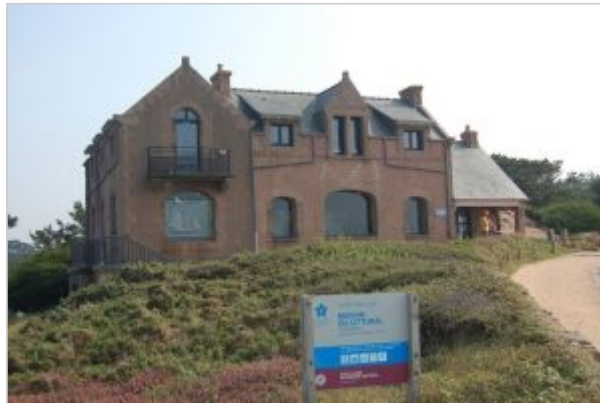
La Maison du Littoral à Ploumanac'h en Perros-Guirec

La presse locale en a abondamment parlé :