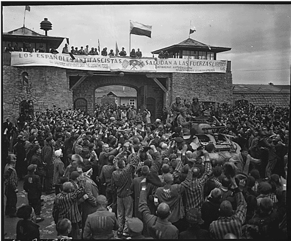
Libération du camp de Mauthausen le 5 mai 1945

Pour ce qui est des victimes, les sources donnent de 122 000 à 320 000 morts, car les Allemands ont détruit une grande partie des documents administratifs.