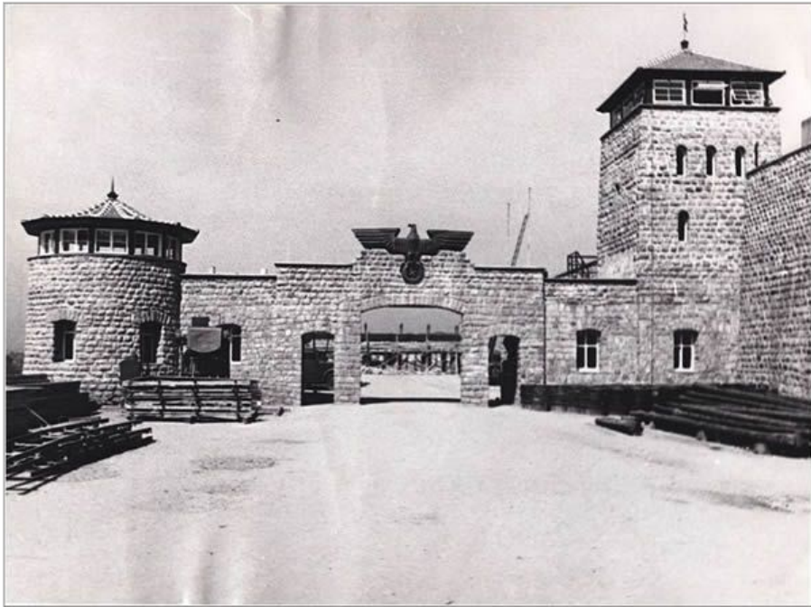
Porte d'entrée du camp de Mauthausen

Le 5 mai 1945, les camps de concentration nazis de Mauthausen et de Gusen en Autriche ont été libérés et le 5 mai 2017 a eu lieu à Almería (Andalousie), la cérémonie en hommage aux 142 combattants républicains espagnols de la province de Almería qui sont morts, victimes du nazisme.