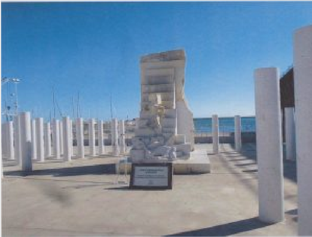
Monument à Almería aux victimes de Mauthausen et de Gusen