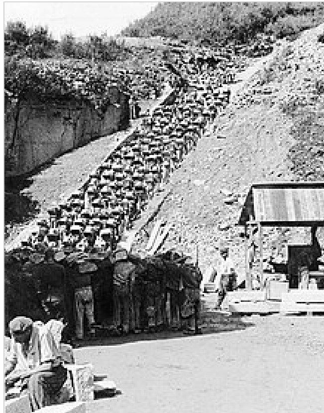
L'escalier de la mort aux 186 marches

Mauthausen et Gusen sont libérés le 5 mai 1945 par la 11 ème division blindée de la 3 ème armée américaine.