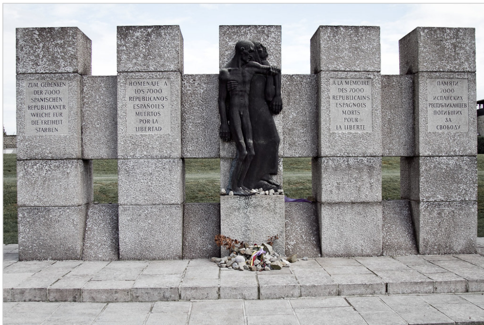
Monument érigé à Mauthausen « À LA MÉMOIRE DES 7 000 RÉPUBLICAINS ESPAGNOLS MORTS POUR LA LIBERTÉ »