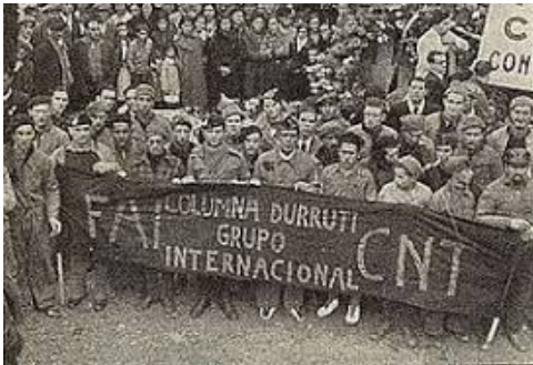
Le Groupe International de la Colonne Durruti à l'enterrement de Buenaventura Durruti (Barcelone, le 23 novembre 1936).