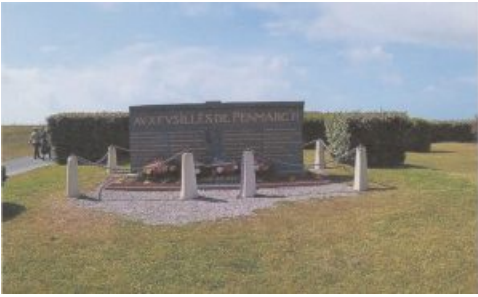
Penmarc'h, 8 mai 2019, après le dépôt des gerbes. (Photo Marie-Louise Sala Pala).