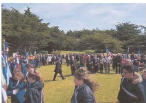
Penmarc'h, 8 mai 2019 : Fin de l'hommage aux 35 résistants.