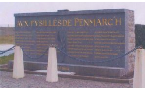
Monument AUX FUSILLÉS DE PENMARC'H, érigé à l'endroit même où se trouvaient les 3 fosses