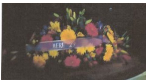
Penmarc'h, 8 mai 2019 : Gerbe de MERE29