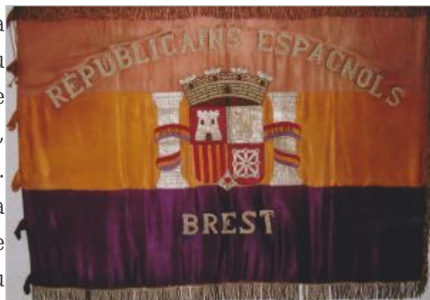
Le drapeau des RÉPUBLICAINS