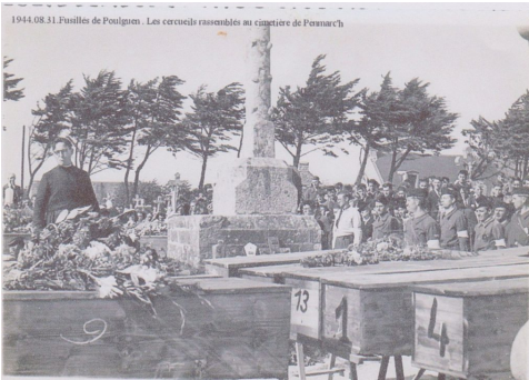
Les cercueils rassemblés au cimetière de Penmarc'h.