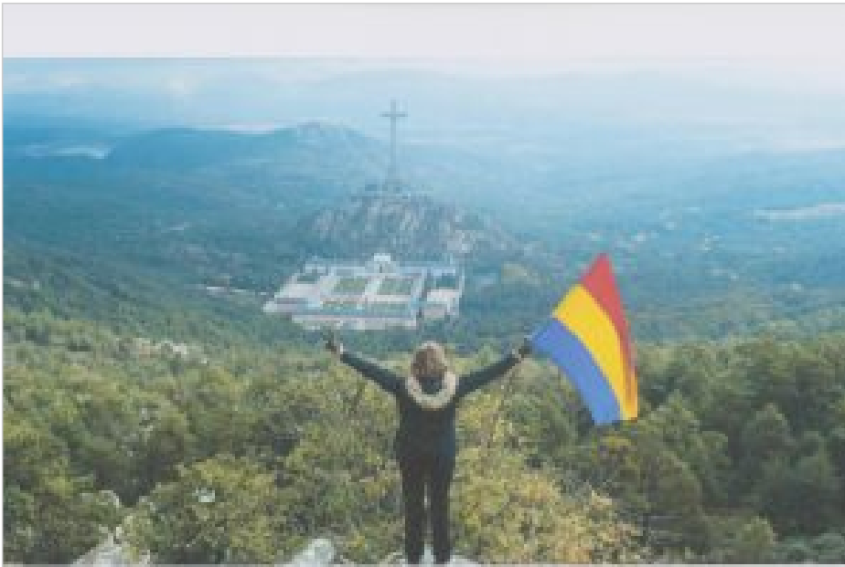
Fotografía del diario Público del 24 de octubre del 2019

POR FIN, enfin, ils ont sorti la momie du dictador Francisco Franco DEL VALLE DE LOS CAÍDOS ce jeudi 24 octobre 2019 !