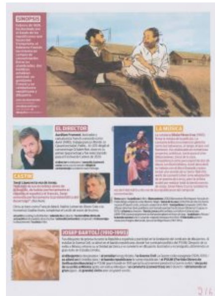
VOSCOPE Film de AUREL : JOSEP Page 1/4