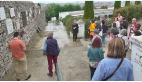
Cimetière de Ceares « El Sucu » de Gijón