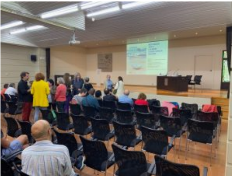
Casa de la Cultura, Ribadesella