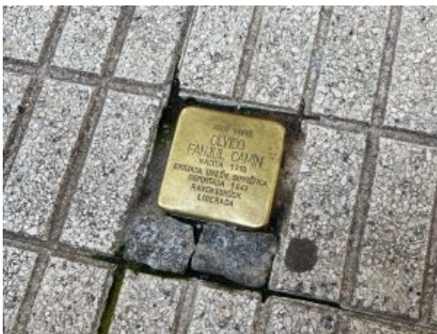
« Stolperstein » de Olvido Fanjul Camín