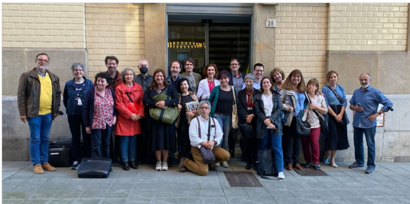
L'équipe après la conférence « La Mar como única salida » à l'École de Commerce de Gijón.

Un très bel accueil de nos amis asturiens nous a été rendu, nous les en remercions vivement.