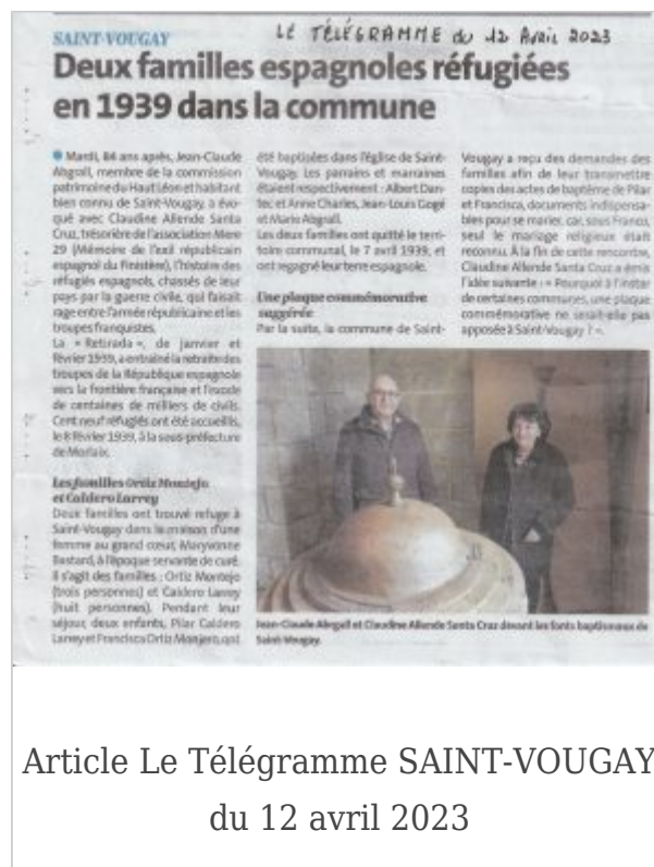
Article Le Télégramme SAINT-VOUGAY du 12 avril 2023

Notre souhait est maintenant de retrouver des descendants ou d'autres renseignements sur ces deux familles en Espagne ?