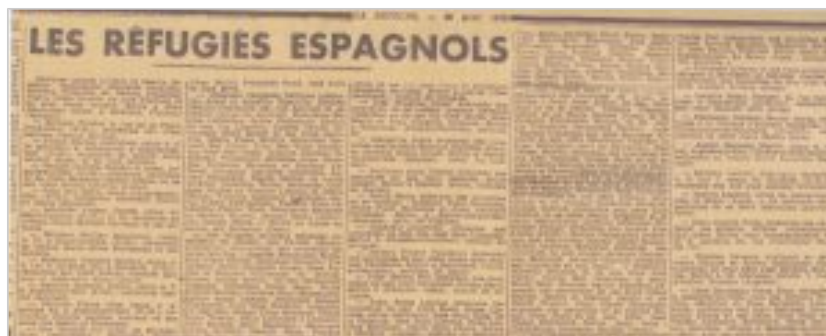
La Dépêche de Toulouse du 23 avril 1939