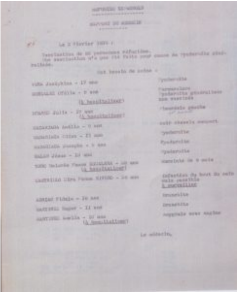
Pont-l'Abbé. Rapport Médecin. Arrivées réfugiés espagnols. AD 29. 1 M 306