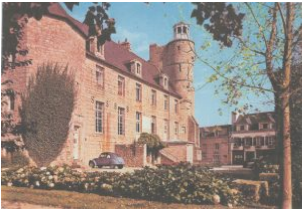
Pont-l'Abbé. Château Mairie

Ces 11 familles de réfugiés espagnols demeurent dans diverses villes d'Espagne comme Baracaldo (Vizcaya), Alcañiz (Teruel), Madrid , Barcelona , Málaga , Tudela Veguín (Asturias), Lorca (Murcia) et Mieres (Asturias).