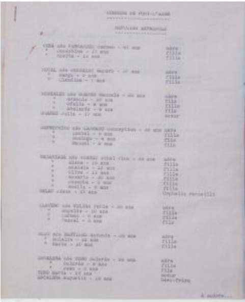
Pont l'Abbé. Liste partielle des arrivées de réfugiés espagnols le 3.2.1939. A D 29. 1 M 306.