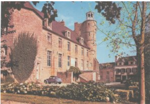
Pont-l'Abbé. Château Mairie

Ces 11 familles de réfugiés espagnols demeurent dans diverses villes d'Espagne comme Baracaldo (Vizcaya), Alcañiz (Teruel), Madrid , Barcelona , Málaga , Tudela Veguín (Asturias), Lorca (Murcia) et Mieres (Asturias).