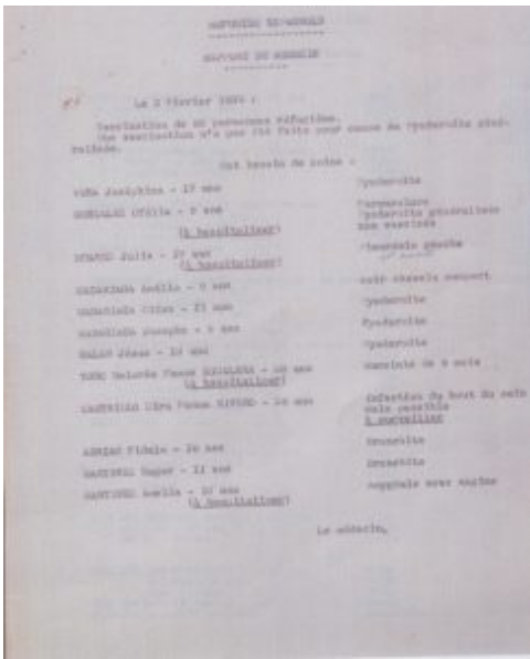
Pont-l'Abbé. Rapport Médecin. Arrivées réfugiés espagnols. AD 29. 1 M 306