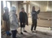
Un pont. Travaux réalisés avec brio, malgré les conditions climatiques.

« Je reviens le voir avant de mourir », dit-il, un peu ému, le visage rayonnant. « Malaga n'est pas loin de chez moi, mais il y a une grande différence de climat. Ici, c'est plus agréable. Je reviens le voir avant de mourir... »