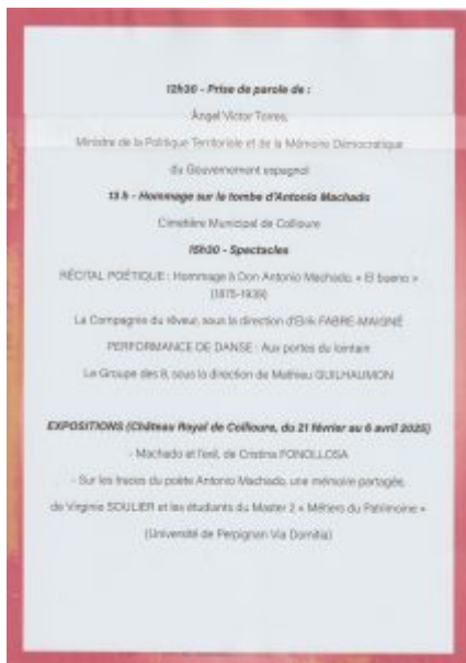
Journée ANTONIO MACHADO. Programme page 2