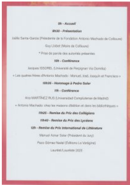
Journée ANTONIO MACHADO. Programme. Page 1